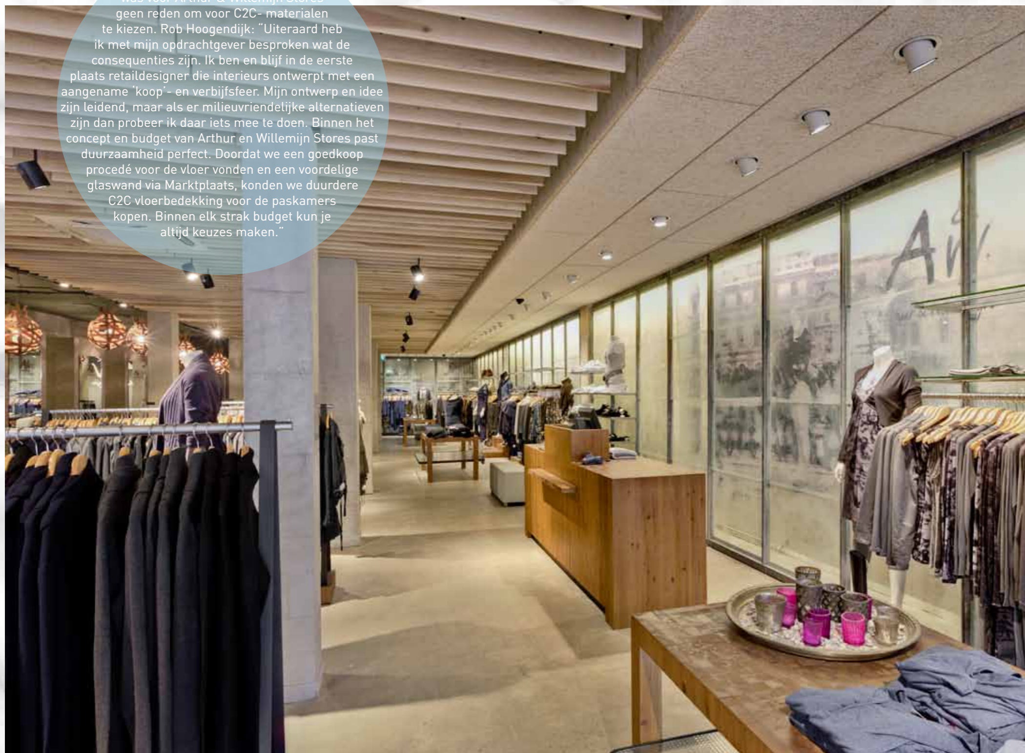
Interieur met de hergebruikte glaswand uit de kasbouw